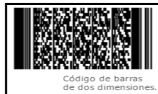
Código de barras de dos dimensiones

Los de dos dimensiones (2-D) que han empezado a usarse en documentos para controlar su envío o en seguros médicos y, en general, en documentos que requieren la inserción de mensajes más grandes (de hasta 2 725 dígitos) como un expediente clínico completo.